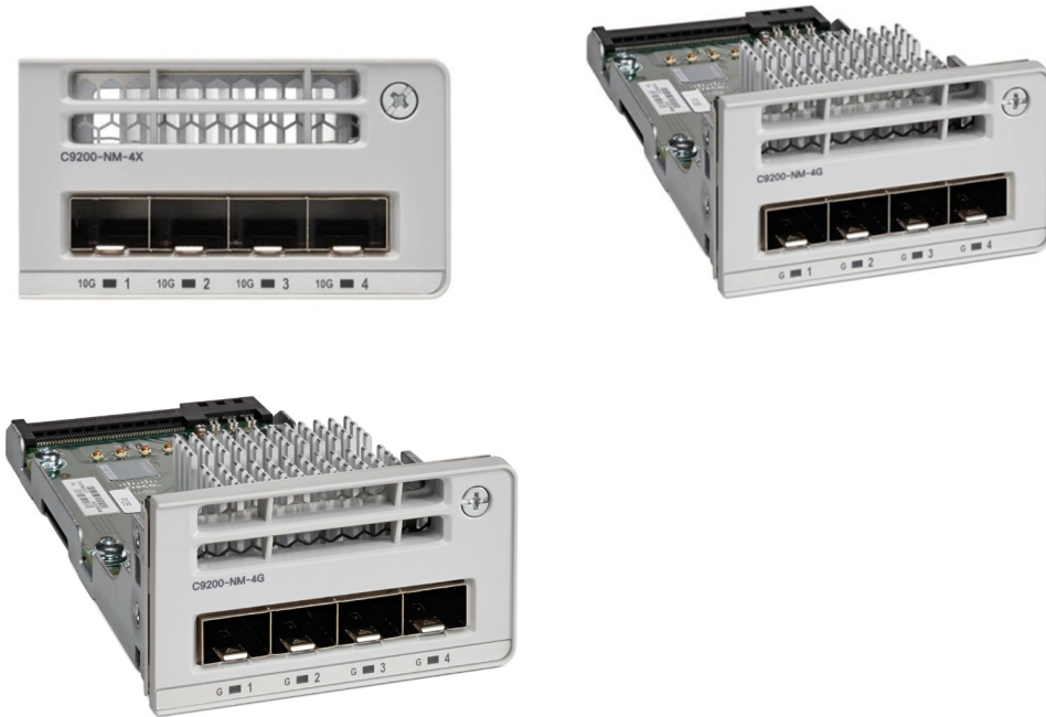
图 2. 思科 Catalyst 9200 系列交换机网络模块

思科 Catalyst 9200 系列交换机配备模块化或非模块化上行链路，如表 1 所示。模块化 SKU 的现场可更换网络模块支持从 1G 无中断迁移到 10G 及更高规格，因此可为您的基础设施投资提供投资保护。在购买交换机时，您可以选择表 2 中列出的网络模块。