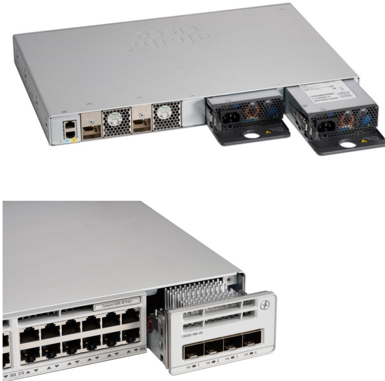
图 3. 思科 Catalyst 9200 系列交换机双冗余电源