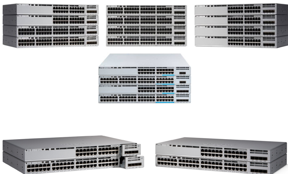
图 1. 思科 Catalyst 9200 系列交换机

思科 Catalyst 9200 系列包括模块化 (C9200) 交换机型号和非模块化 (C9200L) 交换机型号。