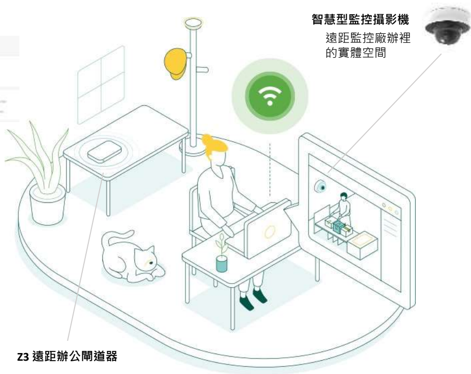
智慧型監控攝影機 遠距監控廠辦裡 的實體空間