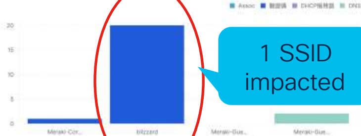
Failed clients by SSID