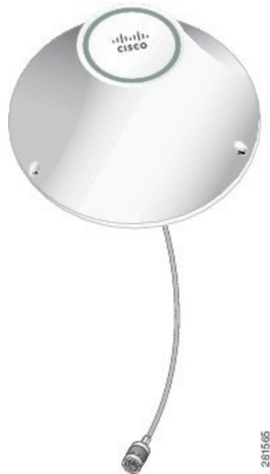
図 1: 4G Volcano アンテナ