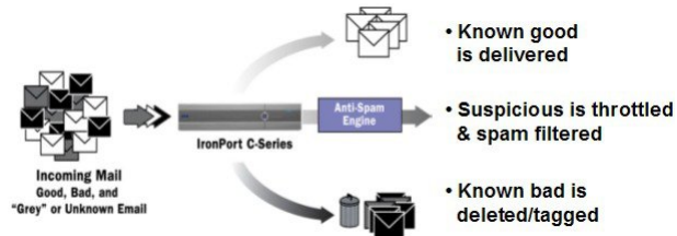
図 2: 送信者レピュテーションフィルタリングの例