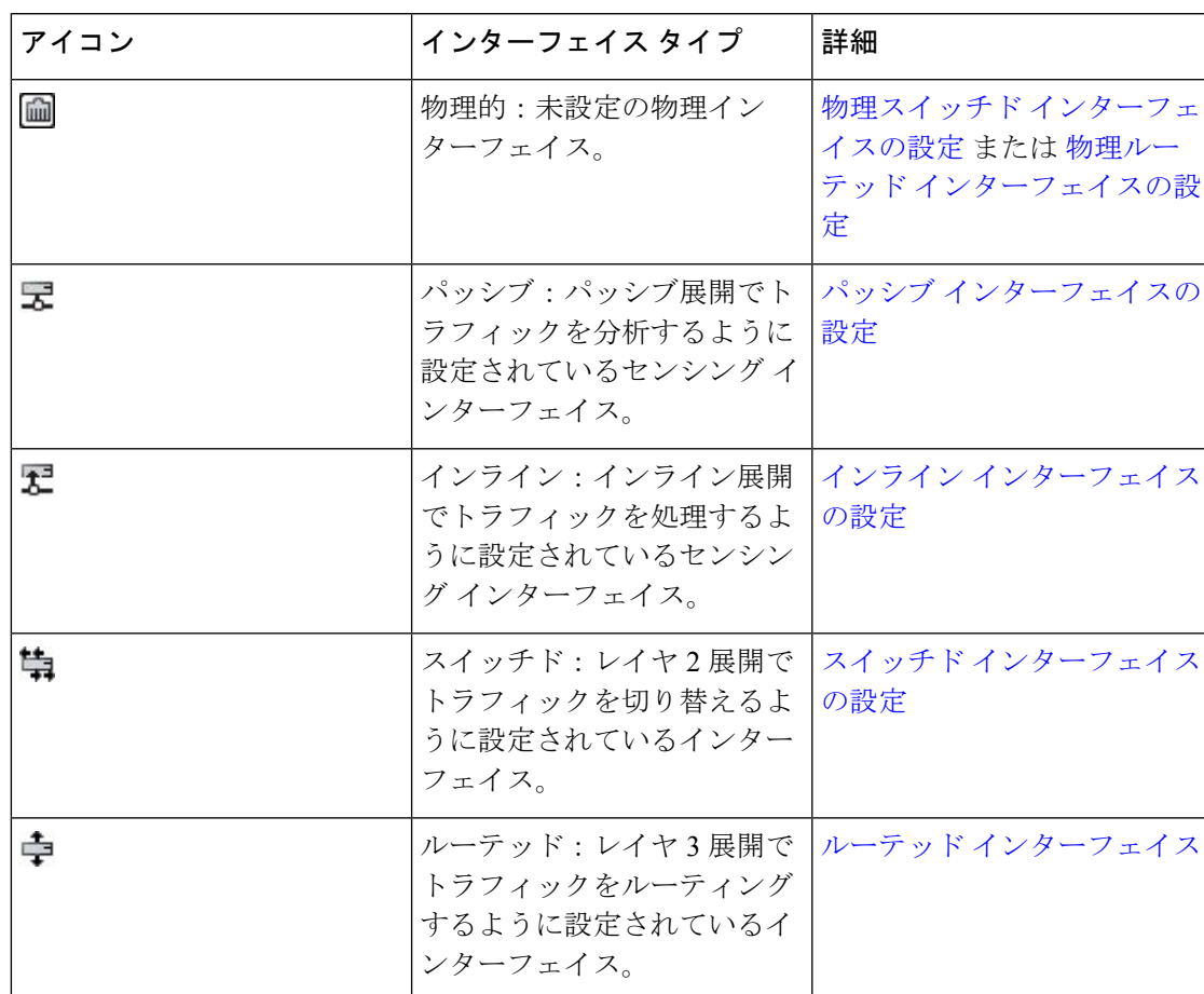
表 1: インターフェイスアイコンのタイプと説明