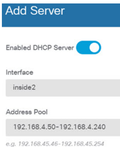
図 4: DHCP サーバ

[構成 (Configuration)] タブでクライアントに提供される WINS および DNS のリストを微調整することもできます。次の例では、アドレスプールの 192.168.4.50 ~ 192.168.4.240 で inside2 インターフェイス上の DHCP サーバを設定する方法を示しています。