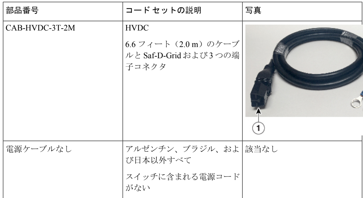
表 1: HVAC/HVDC 電源ケーブルのコールアウト テーブル