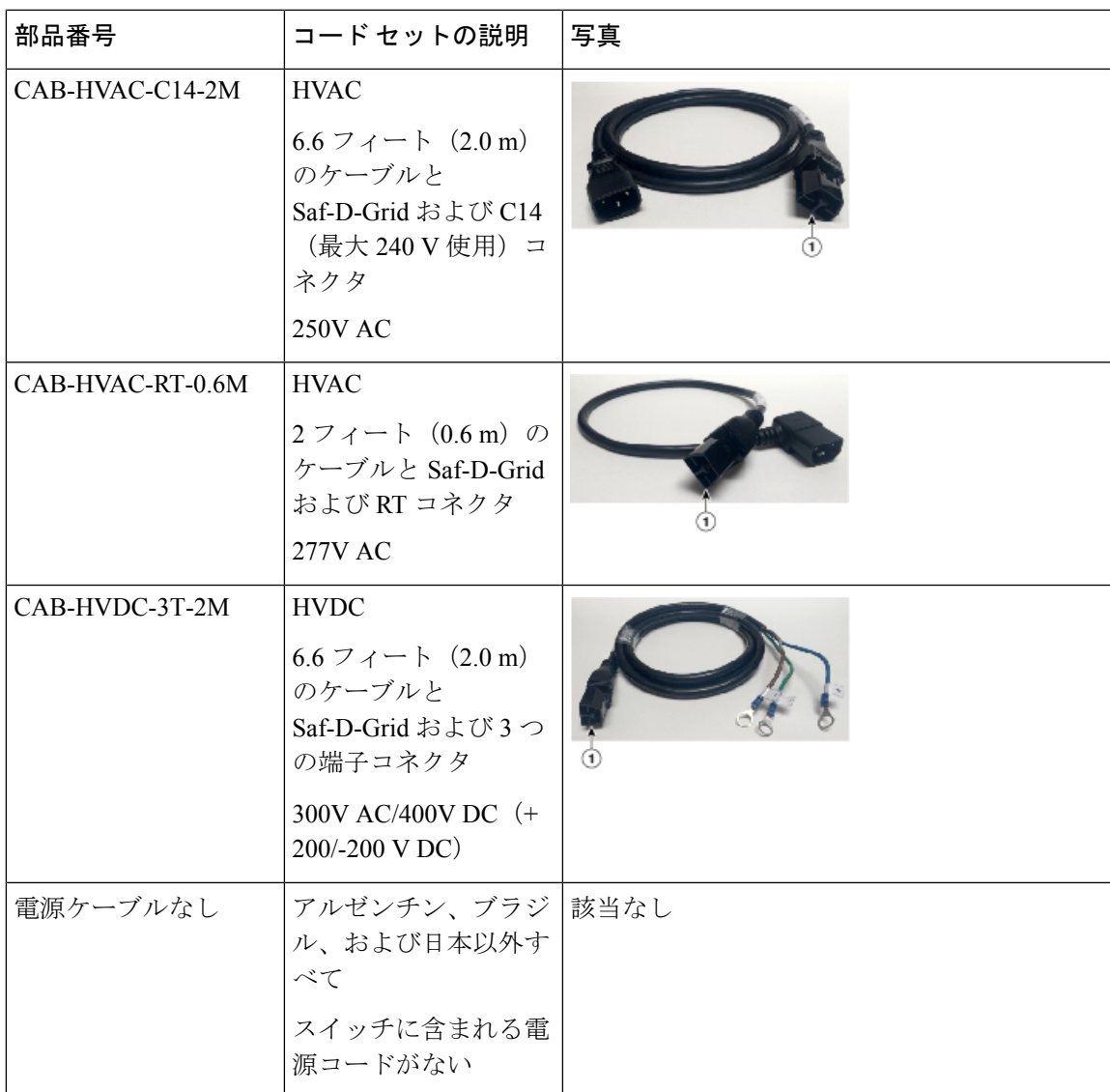
表 1: HVAC/HVDC 電源ケーブルのコールアウト テーブル