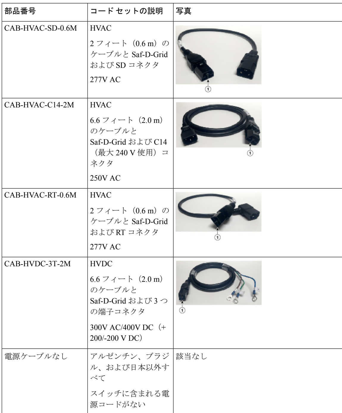
表 1: HVAC/HVDC 電源ケーブルのコールアウト テーブル