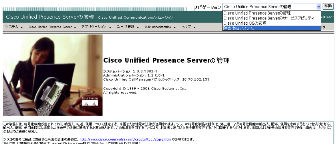
図 1-1 Cisco Unified Presence Server の管理ページのナビゲーション

これらのアプリケーションは、追加のセキュリティで保護されているため、これらのプログラムへアクセスするには、ユーザ ID とパスワードを入力する必要があります。