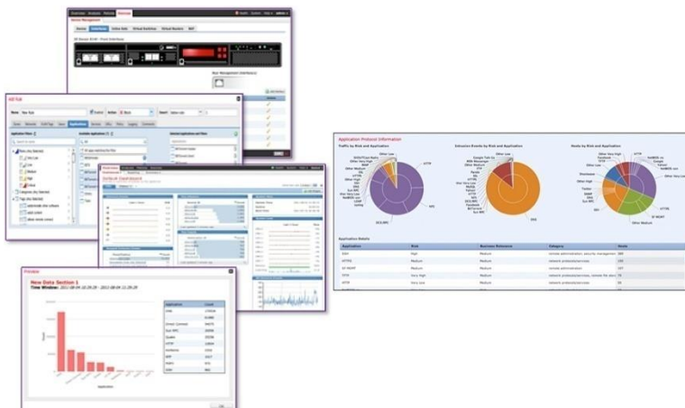
그림 1. 중앙 집중화된 정책, 이벤트, 디바이스 관리

Management Center는 액세스를 제어하고 알려진 공격을 차단할 수 있도록 사용하기 쉬운 정책 화면을 제공합니다. 이는 지능형 악성코드 차단(AMP) 및 샌드박스 기술을 통합하며, 네트워크 전반에 걸쳐 악성코드 감염을 추적할 수 있는 툴을 제공합니다. 또한 하나의 관리 인터페이스에 이러한 모든 기능을 통합합니다. 방화벽 관리부터 애플리케이션 제어, 악성코드 침해 조사 및 치료에 이르기까지 모든 작업을 쉽게 관리할 수 있습니다.