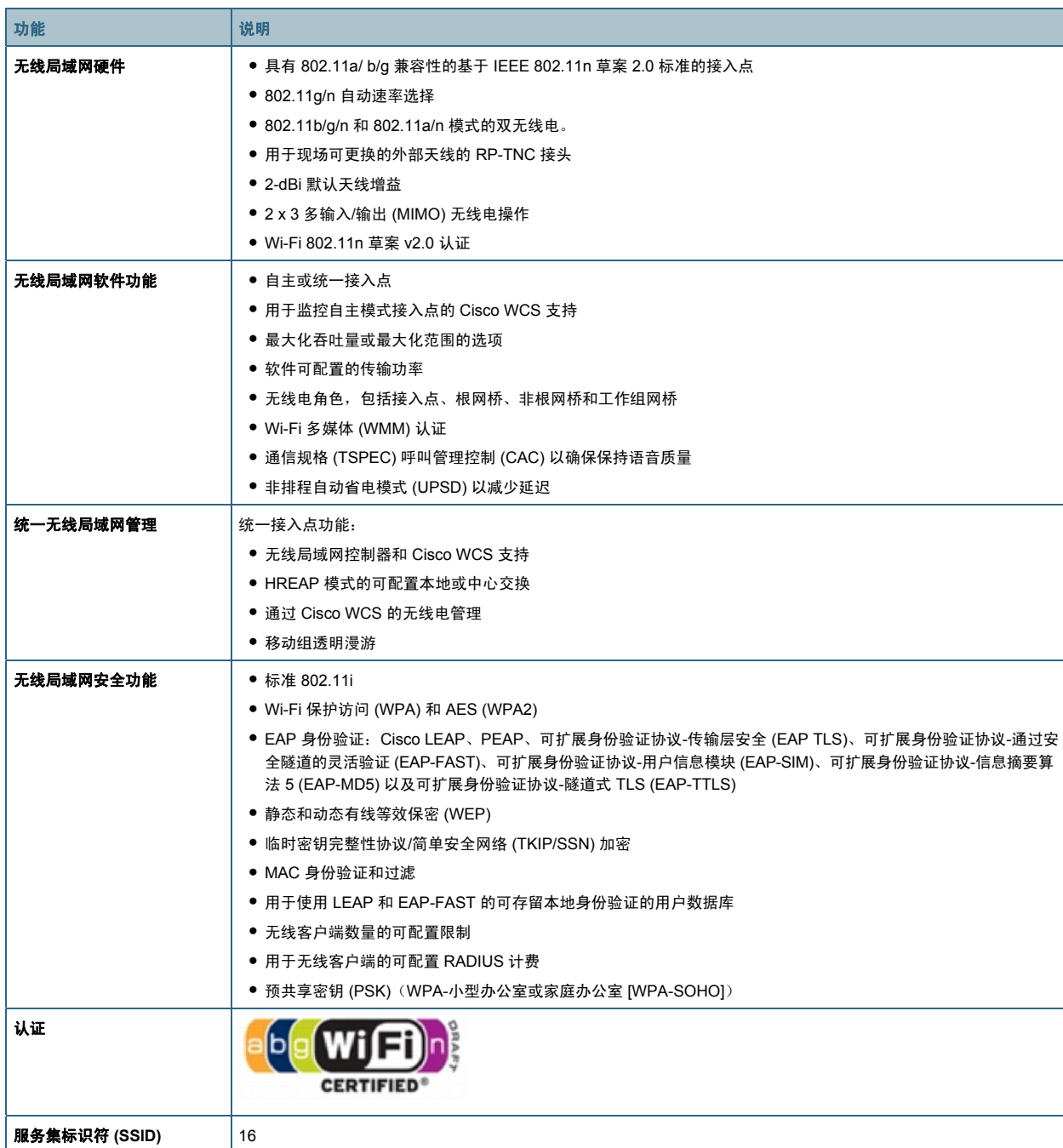
表 8. Cisco 1941W 的无线局域网规格