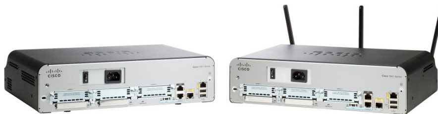
图 1. Cisco 1941 集成多业务路由器

所有 Cisco 1900 系列集成多业务路由器均提供嵌入式硬件加密加速、可选防火墙、入侵预防和应用程序服务。此外,这些平台还支持业界最广泛的有线和无线连接选项,如 T1/E1、xDSL、3G 和 GE。