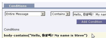
图 10: 内容过滤器中的多个字符集

可以在一个内容过滤器中混搭多个字符集。要获取有关显示和输入采用多个字符编码的文本的帮助, 请参考网络浏览器文档。大多数浏览器都可同时显示多个字符集。